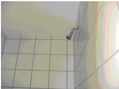
in de badkamer was ook een douche