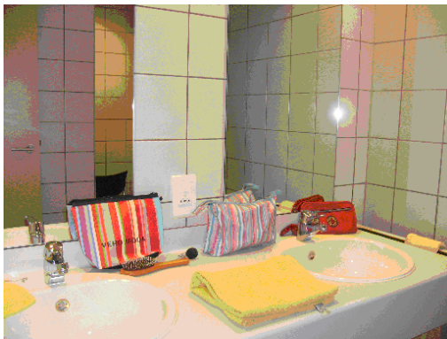
en dit de wastafel,